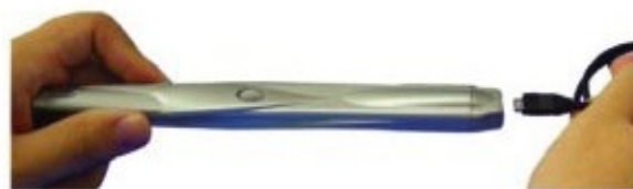
Ricarica di DocuPen R700 con cavo USB

Windows 98/2000/ME/XP CD ROM 32 MB RAM Minimo 60 MB di disco rigido USB